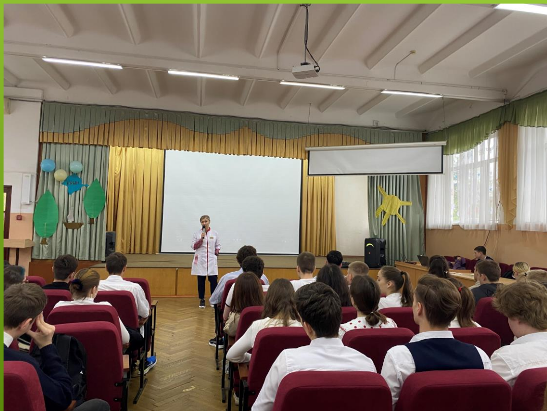
ГБУЗ МЗ КК «Наркологический диспансер»