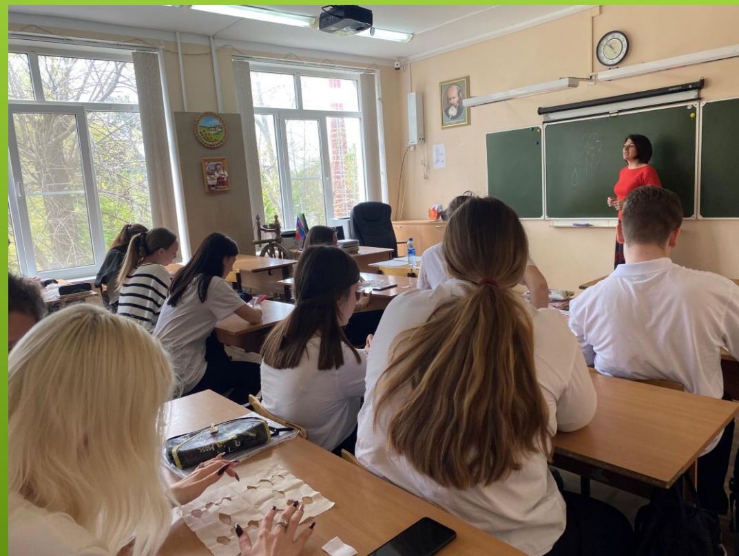
«Центр профилактики вредных зависимостей в молодежной среде»,